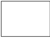
(fotografía del alumno)

D.N.I. o N.I.E. ( o, en defecto de N.I.E., número de pasaporte) ..... Primer apellido..... Segundo apellido..... Nombre..... Fecha de nacimiento..... Lugar..... Provincia..... País..... Nacionalidad ..... Padres o Tutores: Don ..... Doña..... Domicilio: